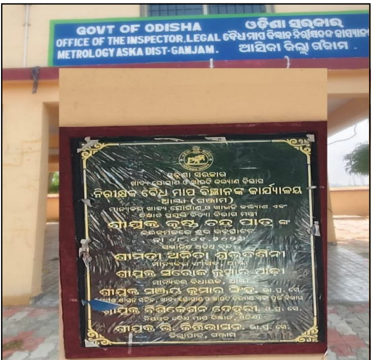
ହୋଇ ରହିଥିଲା। କୋଣାର୍କ ଏକ କାରଣ ବନ୍ଧୁତ୍ଵ ଏହି ଉଦ୍ୟାନ କାର୍ଯ୍ୟକ୍ରମ ସମାପ୍ତ ହେବା ପରେ ଫଳକ ଲାଗିଲା ଏବଂ ଫଳକକୁ ବାହାର କରି