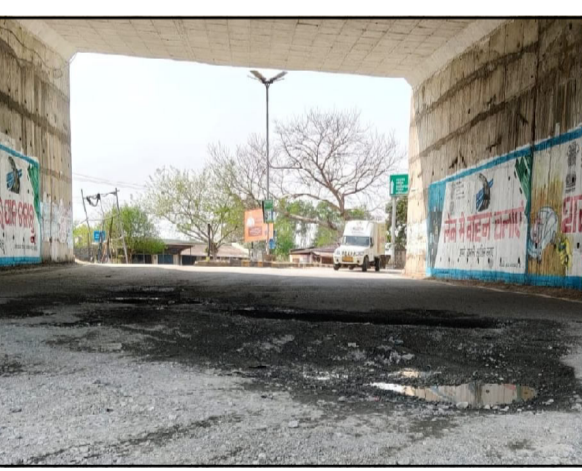
ପରିସ୍ଥିତି କେବଳ ଯାତାୟତକୁ ବ୍ୟସ୍ତ ହେଉଛି ନୁହେଁ, ବର୍ଷା ସମୟରେ ଗୋଲା ପୋଲ ବିପଦଜନକ ହେଉଛି ।

ବାଙ୍କିରିପୋଷି (ଏନ୍.ଏମ୍.): କଳାବଡ଼ିଆ ଗୋଲା ପୋଲ ରାଷ୍ଟ୍ରର ଅବସ୍ଥା ଦିନକୁ ଦିନ ଅତ୍ୟନ୍ତ ଦୟନୀୟ ହେଉଛି । ଏହି ରାଷ୍ଟ୍ର ବାଙ୍କିରିପୋଷି ପଟୁ ଅଧିକାରୀଙ୍କ ଦ୍ୱାରା ବନ୍ଦ, ଗୁଳ, ମୋଟର ଯାନକେଳ ଓ ଅଗୋ ବିକ୍ଷା ଭଳି ଅନେକ ସାଧନବାହାନ ପାଇଁ ଏକ ମୁଖ୍ୟ ଯାତାୟତ ମାର୍ଗ ହେବା ସତ୍ତ୍ୱେ, ଏହାର ଦୁରବସ୍ଥା ଲୋକମାନଙ୍କ ଜୀବନକୁ ସିଧାସଳଖ ବିପଦରେ ପକାଉଛି । ବିଶେଷ କରି ଗୋଲା ପୋଲର ମଧ୍ୟଭାଗରେ ଦୁଇଟି ଚିନୋଟି ବଡ଼ ଗର୍ଭ ସୃଷ୍ଟି ହୋଇଛି, ଯାହା ଦିନକୁ ଦିନ ଆହୁରି ବିସ୍ତୃତ ଓ ଗଭୀର ହେଉଛି । ବର୍ଷା ପାଣି ଜମି ଏହି