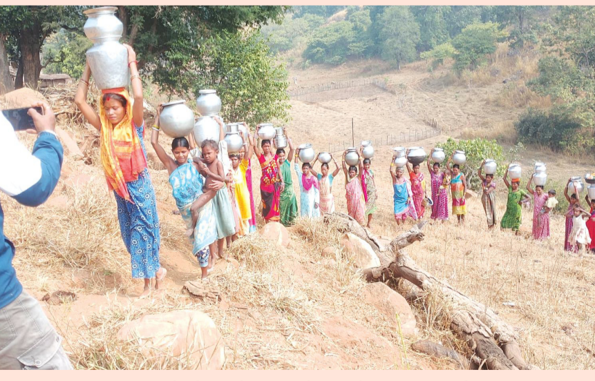
ଗଣି ଗୁଡ଼ା ଗ୍ରାମବାସୀମାନେ ମୌଳିକ ସୁବିଧାରୁ ବଞ୍ଚିତ ଅଛନ୍ତି ।

ମୌଳିକ ସୁବିଧାରୁ ବଞ୍ଚିତ ଗଣି ଗୁଡ଼ା ଗ୍ରାମବାସୀ । ଏହି ଗ୍ରାମବାସୀମାନେ ମୌଳିକ ସୁବିଧାରୁ ବଞ୍ଚିତ ଅଛନ୍ତି ।