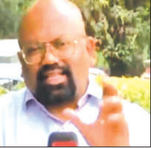
ଉପରେ ସଞ୍ଜମତ ହୋଇଥିଲା । ସେ କହୁ କହୁ ଅଶ୍ରୁମଳ ଭାଷା କହିଦେଇଥିଲେ । ଏହାପରେ ତୁରନ୍ତ ଆମେ ଆପଣଙ୍କ କଥା ଶୁଣିପାରୁନୁ କହି ଲାଇଭ୍ ରିପୋର୍ଟରଙ୍କୁ ବନ୍ଦ କରାଯାଇଥିଲା । ପୁରୀ ଘଟଣାର ଭିତ୍ତି

ଦୁଆବିଲ୍ଲା (ଏକେନ୍ଦ୍ର): ଲାଇଭ୍ ରିପୋର୍ଟ ବେଳେ ହୋଇଗଲା ବଡ଼ ଲୁଲ୍ । ଭାଷା ଉପରେ ରହିଲାଟି ସଞ୍ଜମତ । ଅଶ୍ରୁମଳ ଭାଷା କହି ହୋଇ ହେଲେ ରିପୋର୍ଟର । ଏହାର ଭିତ୍ତି ଏବେ ଯୋଗାଣ ମିଡ଼ିଆରେ ଭାଇଗଲା ହେବାରେ ଲାଗିଛି । ମଙ୍ଗଳବାର ପତଞ୍ଜଳି ବିଭାଗିକର ବିଜ୍ଞାପନ ମାମଲାରେ କ୍ଷମା ପ୍ରାର୍ଥନାକୁ ବେଳ ସୁପ୍ରିମକୋର୍ଟରେ ଶୁଣାଣି ଚାଲିଥିଲା । ଏହି ପ୍ରସଙ୍ଗକୁ ନେଇ କୋର୍ଟ ବାହାରେ ଲାଇଭ୍ ରିପୋର୍ଟ କରୁଥିଲେ ଜଣେ କାତାୟ ଗଣମାଧ୍ୟମର ରିପୋର୍ଟର । ଶୁକ୍ଳ ଓରେ ଥିବା ଟିଭି ଆକାର ରିପୋର୍ଟରଙ୍କୁ ପତଞ୍ଜଳି ମାମଲା ବିଷୟରେ ପ୍ରଶ୍ନ କରୁଥିଲେ । ଏତିକି ବେଳେ ରିପୋର୍ଟର ଜଣକ ନିଜ ଭାଷା