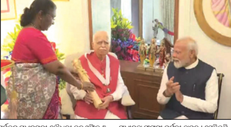
ପୂର୍ବତନ ପ୍ରଧାନମନ୍ତ୍ରୀ ତୃତୀୟା ଚରଣସିଂହ ଓ ପି.ଭି.ନରସିଂହା ରାଓ, କୃଷି ବୈଜ୍ଞାନିକ ତଥା ଶର୍କର ବିପ୍ଳବ ଜନକ ଏମ୍.ଏସ୍.ସ୍ୱାମୀନାଥନ ଆଦିଙ୍କୁ ମରଣୋତ୍ତର ଭାବେ ଭାରତ ରତ୍ନ ପ୍ରଦାନ କରାଯାଇଛି।

ନୂଆଦିଲ୍ଲୀ(ଏକେନ୍ଦ୍ର): ଦେଶର ସର୍ବୋଚ୍ଚ ବେସାମରିକ ସମ୍ମାନ ଭାରତ ରତ୍ନ ପ୍ରଦାନ କରାଯାଇଛି। ଚଳିତ ବର୍ଷ ପାଇଁ ମନୋନୀତ ବିଶିଷ୍ଟ ବ୍ୟକ୍ତିଙ୍କୁ ଭାରତ ରତ୍ନ ସମ୍ମାନରେ ସମ୍ମାନିତ ହୋଇଛନ୍ତି। ଆଜି ରାଷ୍ଟ୍ରପତି ଭବନରେ ଆୟୋଜିତ କାର୍ଯ୍ୟକ୍ରମରେ ରାଷ୍ଟ୍ରପତି ଦ୍ରୌପଦୀ ମୁର୍ମୁ ଭାରତ ରତ୍ନ ସମ୍ମାନ ପ୍ରଦାନ କରିଛନ୍ତି। ଚଳିତ ବର୍ଷ ଭାରତ ରତ୍ନ ସମ୍ମାନ ପାଇଁ ଆଜି ୪ ଜଣଙ୍କୁ ମରଣୋତ୍ତର ଭାବେ ଭାରତ ରତ୍ନ ପ୍ରଦାନ କରାଯାଇଛି। ପୂର୍ବତନ ଉପପ୍ରଧାନମନ୍ତ୍ରୀ ତଥା ବରିଷ୍ଠ ବିଜେପି ନେତା ଲାଲକୃଷ୍ଣ ଆଡଭାନୀଙ୍କୁ ପରବର୍ତ୍ତୀ ସମୟରେ ଭାରତ ରତ୍ନ ପ୍ରଦାନ କରାଯିବ। ମରଣୋତ୍ତର ଭାବେ ସମ୍ମାନ ପାଇଥିବା ଚାରି ବିଶିଷ୍ଟ ବ୍ୟକ୍ତି ହେଉଛନ୍ତି,