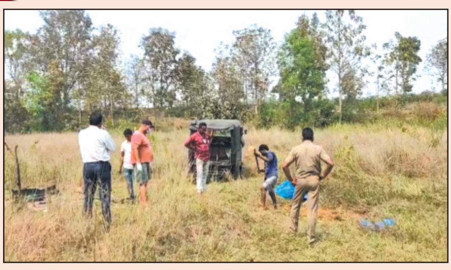
କରିଥିଲେ । ତେଣୁ ମୃତଦେହ ସକ୍ୱାର କଲ ପୁଲିସ୍ ଓ ସ୍ୱେଚ୍ଛାସେବୀ । ପୂରା ଘଟଣା ଏମିତି । ଗତ ୨୬ ତାରିଖରେ ସମ୍ବଲପୁର ଜିଲ୍ଲା ବାମନା ଦୁର୍ଗ ଗଡ଼ପୋଷ(ସୌରୁକବାହାଲ) ଗାଁ ନିକଟ ରେଳ ଧାରଣା ପାର୍ଶ୍ୱରେ ଜଣେ ସୁବକଳ ମୃତଦେହ ପଡ଼ିଥିଲା । ବାମନା

କୂଟଣା(ଏନ.ଏମ.): ଜନ୍ମ ଠାରୁ ମୃତ୍ୟୁ ପର୍ଯ୍ୟନ୍ତ ସରକାର ବିଭିନ୍ନ ଯୋଜନା କରିଥିବାବେଳେ ସମସ୍ତଙ୍କ ପାଖରେ ପହଞ୍ଚି ପାରୁନି ସରକାରୀ ଯୋଜନା । ବଡ଼ବଡ଼ିଆ ବାବୁ ମାନଙ୍କ ପାଇଲଟ୍‌କେ ଗପି ହୋଇ ରହିଯାଉଛି ବହୁ ଗରିବ ଅସହାୟ ପରିବାର ଲୋକଙ୍କ ଭାଗ୍ୟ । କେତେବେଳେ ପ୍ରଶାସନିକ ଅଧିକାରୀଙ୍କ ଖାମୁଖୁଆଲି ନୀତିର ଆଉ କେତେବେଳେ ରାଜନୈତିକ ବ୍ୟକ୍ତିବିଶେଷଙ୍କ ଆକ୍ରମଣ । ଏହିଭଳି ବିଭିନ୍ନ କାରଣ ଯୋଗୁଁ ପ୍ରକୃତ ହିରାଧିକାରୀ ପାଖରେ ଅପହଞ୍ଚି ହୋଇ ପଡୁଛି ସରକାରଙ୍କ ମାଲମାଲ ଯୋଜନା । ସତେ ଯେମିତି ଏସବୁ ଦିଗ୍‌ହରା ହୋଇ ପଡ଼ିଛି । ଏଭଳି ଅଭାବନାୟ ଘଟଣା ଦେଖିବାକୁ ମିଳିଛି ସମ୍ବଲପୁର ଜିଲ୍ଲା ଅଞ୍ଚଳରେ । ଅସହାୟ ଏ ପରିବାର ! ଯେଉଁ ପରିବାର ପାଇଁ ଘର ଦ୍ୱାର ଛାଡ଼ି ଘରଦ ଖଟିବାକୁ ଯାଇଥିଲେ । ଭବିଷ୍ୟରେ ଗୋଟିଏ ଭାଗ୍ୟ ଆଣିଲେ ପରିବାର ଲୋକଙ୍କ ପେଟରେ ଦାନା ଦେବେ । ହେଲେ ଦୁର୍ଭାଗ୍ୟ ଦେଖିବୁ ଦାନଦ ଖଟିବାକୁ ଯାଇ ଶବ ପାଇଗିଗଲେ । ଘରକୁ ଫେରିପାରିଲେ ନାହିଁ । ଆର୍ଥିକ ଅନାବରଣ ଘଣ୍ଟି ହେଉଥିବା ପରିବାର ଲୋକେ ମଧ୍ୟ ମୃତଦେହ ନେବା ପାଇଁ ଅସହାୟତା ପ୍ରକାଶ