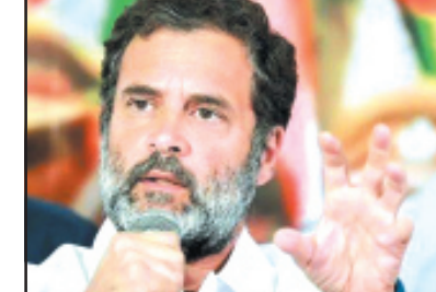
ଆଲାଇନ୍‌ର ସମସ୍ତ କର୍ମୀଙ୍କୁ ସ୍ୱାଗତ କରି ସେ କହିଛନ୍ତି ଯେ ଆଜିକାଲି ଆଇପିଏଲ୍ ମ୍ୟାଚ୍ ଚଳିଛି । ସେ କହିଛନ୍ତି ଯେ ଅପାୟୀତ କିଣିବା ସହ ଅଧିକାରୀଙ୍କୁ ଭୟଭୀତ କରି ମ୍ୟାଚ୍ ଫିକ୍ସିଂ ପରେ ଆପଣ ମ୍ୟାଚ୍ ଫିକ୍ସିଂ ଶବ୍ଦ ଶୁଣିଥିବେ । ରାହୁଲ

ନୂଆଦିଲ୍ଲୀ(ଏକେନ୍ଦ୍ର): କଂଗ୍ରେସର ପୂର୍ବତନ ସଭାପତି ରାହୁଲ ଗାନ୍ଧୀ ଆଜି ରାମଲୀଳା ମୈଦାନରେ ଗଣତନ୍ତ୍ର ଦଞ୍ଚା ରାଜିକୁ ସମୟାଧିକ କରି କହିଛନ୍ତି ଯେ ଏହି ନିର୍ବାଚନ ସାଧାରଣ ନିର୍ବାଚନ ନୁହେଁ। ଗଣତନ୍ତ୍ର, ସମ୍ପର୍କ, ଗରିବ ଏବଂ କୃଷକଙ୍କୁ ବଞ୍ଚାଇବା ପାଇଁ ଏହି ନିର୍ବାଚନ । ସେ ଅଭିଯୋଗ କରିଛନ୍ତି ଯେ ଏଠାରେ ମ୍ୟାଚ୍ ଫିକ୍ସିଂ କରାଯାଉଛି ଏବଂ ପ୍ରଧାନମନ୍ତ୍ରୀ ନରେନ୍ଦ୍ର ମୋଦି ନିର୍ବାଚନ ପୂର୍ବରୁ ମ୍ୟାଚ୍ ଫିକ୍ସିଂ କରୁଛନ୍ତି । ରାହୁଲ ଗାନ୍ଧୀ କହିଛନ୍ତି ଯେ ଦିଲ୍ଲୀ ମୁଖ୍ୟମନ୍ତ୍ରୀ ଅରବିନ୍ଦ କେଜ୍ରିୱାଲ ଏବଂ ଖାଡ଼ଖଣ୍ଡର ପୂର୍ବତନ ମୁଖ୍ୟମନ୍ତ୍ରୀ ହେମନ୍ତ ଘୋଷେ ନିର୍ବାଚନ ନିର୍ଦ୍ଦୋଷ କରିବା ପାଇଁ ଚାହୁଁଛନ୍ତି ।