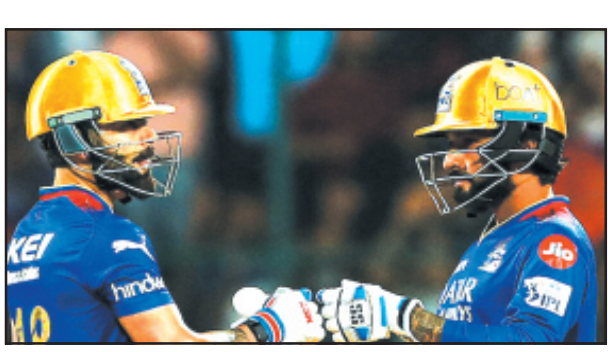
ଆଇପିଏଲ ଆରମ୍ଭ ହେବା ଦିନରୁ ଅର୍ଥର ୨୦୦ରୁ ଆରସିବି ସହିତ ଅଛନ୍ତି । ଆଇପିଏଲରେ ୨୪୯ଟି ଛକା ମାରି ସେ ମହେନ୍ଦ୍ର ସିଂହ ଧ୍ୟୋନିଙ୍କ ରେକର୍ଡ ମଧ୍ୟ ଭାଙ୍ଗିଛନ୍ତି । ମୋଟ ଉପରେ ଛକା ମାରିବାର ସର୍ବାଧିକ ଅଛନ୍ତି ଲୁଗେଶ୍ୱର । ସେ ୨୩୯ଟି ଛକା ମାରିଛନ୍ତି । ଗାଁ ତେଜୁ ଅଛନ୍ତି ଗୁରୁ ମ୍ୟାଟ୍ଟୁସେନ । ସେ ୨୬୯ଟି ଛକା ମାରିଛନ୍ତି । ୨୫୯ଟି ଛକା ସହିତ ୩ ନମ୍ବରରେ ଅଛନ୍ତି ଏବଂ ତି ଚଳିତରେ । ୪ ନମ୍ବରରେ ଥିଲେ ଧ୍ୟୋନି । ସେ ୨୩୯ଟି ଛକା ମାରିଛନ୍ତି ।

ବେଙ୍ଗାଲୁରୁ(ଏନ୍.ଏମ.): ଚଳିତ ଆଇପିଏଲରେ କୋଲକାତା ନାଇଟ ରାଇଡର୍ସ ୭ ଡିକେଟରେ ଉତ୍ତମ ଚ୍ୟାଲେଞ୍ଜରୀବେଙ୍ଗାଲୁରୁ ପରାସ୍ତ କରିଛି । ବିରାଟ ଏହି ମ୍ୟାଚରେ ୮୩ ରନ୍ କରିଥିଲେ । କିରୁ ଚାକ୍ ଦଳ ଉତ୍ତମ ଚ୍ୟାଲେଞ୍ଜରୀ (ଆରସିବି) ପରାସ୍ତ ହୋଇଥିଲା । ମ୍ୟାଚ ହାରିଥିଲେ ମଧ୍ୟ ବିରାଟଙ୍କ ନିର୍ଦ୍ଦେଶ ଏକ ରେକର୍ଡ ଯୋଡ଼ି ହୋଇଯାଇଛି । ଅଇପିଏଲରେ ଆରସିବି ପକ୍ଷରୁ ସର୍ବାଧିକ ଛକା ମାରିବାର ରେକର୍ଡ ବିରାଟଙ୍କ ନିର୍ଦ୍ଦେଶ ଯୋଡ଼ି ହୋଇଛି । ପୂର୍ବରୁ ଏହି ରେକର୍ଡ ଲୁଗେଶ୍ୱର ନିର୍ଦ୍ଦେଶ ଥିଲା । ତ୍ରିପ୍ ଗେଲ୍ ଆରସିବି ପକ୍ଷରୁ ଖେଳି ୨୩୯ଟି ଛକା ମାରିଥିବା ବେଳେ କେହି ୨୪୯ଟି ଛକା ମାରିଛନ୍ତି । ଏହି ଚଳିତରେ ୩ ନମ୍ବରରେ ରହିଛନ୍ତି ଏବଂ ତି ତି ଚଳିତରେ । ସେ ଆର୍ସିବି ପକ୍ଷରୁ ଖେଳି ୨୩୮ଟି ଛକା ମାରିଛନ୍ତି । ଗାଁ ତେଜୁ ରହିଛନ୍ତି ଗୁରୁ ମ୍ୟାଟ୍ଟୁସେନ (୬୬) ଓ ଫାଟୁ ତୁ ପ୍ରେସିଏ (୫୦) । କେହି