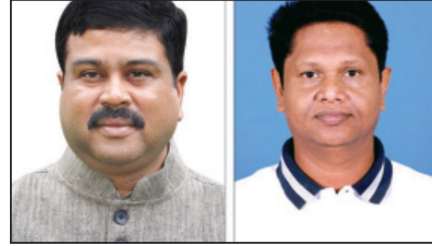
ଏହି ନିର୍ବାଚନମଣ୍ଡଳରୁ ପ୍ରାର୍ଥୀହେବା ଲକ୍ଷ୍ୟରେ ପ୍ରୟତ୍ନ ଆରମ୍ଭ କରିବେହେଲେ । କେନ୍ଦ୍ରମନ୍ତ୍ରୀ ଓ ତାଙ୍କ