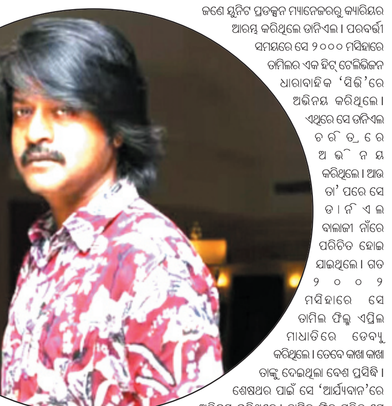
ଜଣେ ସୁନିତ ପ୍ରତ୍ୟକ୍ତ ମ୍ୟାନେଜରକୁ କ୍ୟାଣ୍ଡିଡେ ଆରମ୍ଭ କରିଥିଲେ ତାନିଏଲ। ପରବର୍ତ୍ତୀ ସମୟରେ ସେ ୨୦୦୦ ମସିହାରେ ତାମିଲ ଏକ ହିଟ୍ ଟେଲିଭିଜନ ଧାରାବାହିକ 'ସିଦ୍ଧି'ରେ ଅଭିନୟ କରିଥିଲେ। ଏଥିରେ ସେ ତାନିଏଲ ଚିତ୍ରରେ ଅଭିନୟ କରିଥିଲେ। ଆଉ ତା' ପରେ ସେ ତାନିଏଲ ବାଲାଜୀ ନାଁରେ ପରିଚିତ ହୋଇ ଯାଇଥିଲେ। ଗତ ୨୦୦୯ ମସିହାରେ ସେ ତାମିଲ ଫିଲ୍ମ 'ସାଧା'ରେ ତେଦ୍ୟୁ କରିଥିଲେ। ତେବେ କଣା କଣା ତାଙ୍କୁ ଦେଉଥିଲା ବେଶ୍ ପ୍ରସିଦ୍ଧି। ଶେଷଥର ପାଇଁ ସେ 'ଆର୍ଯ୍ୟବାଦ'ରେ ଅଭିନୟ କରିଥିଲେ। ତାମିଲ ଫିଲ୍ମ ସହିତ ସେ ପରଲୋକର ଖବର ପାଇବା ପରେ ଭାରତର ସମସ୍ତ ଫିଲ୍ମ ଜଗତରେ ଶୋକର ଛାୟା ଖେଳି ଯାଇଛି। ତାଙ୍କ ବିୟୋଗରେ ହଲିଭୁଡ୍, ବଲିଭୁଡ୍ ଏବଂ ଓଲିଭୁଡ୍ ବନ୍ଧୁ ଅଭିନେତା ଶୋକ ପ୍ରକାଶ କରିଛନ୍ତି। ତାଙ୍କର ଅକାଳ ବିୟୋଗ ଭାରତୀୟ ଚଳଚ୍ଚିତ୍ର ପାଇଁ ଏକ ଅପୂରଣୀୟ କ୍ଷତି ବୋଲି ବିଭିନ୍ନ ମହଲରେ ମତପ୍ରକାଶ ପାଇବା ସହ ସ୍ୱର୍ଗତ ବାଲାଜୀଙ୍କ ଆତ୍ମାର ସଦଗତି ନିମନ୍ତେ ପ୍ରାର୍ଥନା କରାଯିବା ସହ ତାଙ୍କ ଶୋକ ସତ୍ୟ ପରିବାର ପ୍ରତି ସମବେଦନା ଜ୍ଞାପନ କରାଯାଇଛି।

ତେନ୍ଦ୍ରାଲ (ଏକେଡ୍): ତାମିଲ ନାଡୁର ବିଶିଷ୍ଟ ଅଭିନେତାଙ୍କ ଅକାଳ ବିୟୋଗ ନେଇ ସାରା ଦେଶର ଫିଲ୍ମ ଜଗତରେ ଶୋକର ଛାୟା ଖେଳିଯାଇଛି। ନକରାତୁକ ଚରିତ୍ରରେ ଅଭିନୟ କରୁଥିବା ଜଣେ ସକରାତୁକ ଚିତ୍ରାଧାରୀ ବ୍ୟକ୍ତିତ୍ୱକୁ ହରାଇ ଚଳିଭଡ଼ ବେଶ ମର୍ମାହତ ହୋଇ ପଡ଼ିଛି। ବିଶିଷ୍ଟ ତାମିଲ ଅଭିନେତା ଟି. ସି. ବାଲାଜୀ ଓରଫ ଟି. ସି. ବାଲାଜୀଙ୍କର ଗତ ଶୁକ୍ରବାର ରାତିରେ ଚେନ୍ନାଇରେ ଏକ ଘରୋଇ ଡାକ୍ତରଖାନାରେ ପରଲୋକ ହୋଇ ଯାଇଛି। ତେବେ ତାଙ୍କର ହୃଦୟାତ ଯୋଗୁ ମୃତ୍ୟୁ ଘଟିଥିବା ଜଣାପଡ଼ିଛି। ମୃତ୍ୟୁ ବେଳକୁ ତାଙ୍କୁ ୪୮ ବର୍ଷ ହୋଇଥିଲା। ତାନିଏଲ ଗତ ଶୁକ୍ରବାର ଦିନ ତାଙ୍କ ଛାତିରେ ଯନ୍ତ୍ରଣା ଅନୁଭବ କରିଥିଲେ। ତାଙ୍କୁ ସଙ୍ଗେ ଡାକ୍ତରଖାନା ନିଆଯାଇଥିଲା। ସେଠାରେ ଡାକ୍ତରମାନେ ତାଙ୍କର ଚିକିତ୍ସା କରିଥିଲେ। ତେବେ ଚିକିତ୍ସାଧୀନ ଅବସ୍ଥାରେ ତାଙ୍କର ମୃତ୍ୟୁ ଘଟିଥିଲା। ତାନିଏଲ ବାଲାଜୀଙ୍କ ମୃତ୍ୟୁ ଖବର ପାଇବା ପରେ ତାଙ୍କ ବନ୍ଧୁମାନଙ୍କ, ସାଙ୍ଗପାଆଁ, ଫ୍ୟାନ୍ ଓ ତାମିଲ ଚଳଚ୍ଚିତ୍ର ଜଗତ ସହିତ ଜଡ଼ିତ ପ୍ରତ୍ୟେକ ଲୋକ ଝଟି ହୋଇ ଯାଇଛନ୍ତି। ଫିଲ୍ମରେ ନେତୃତ୍ୱ ଚରିତ୍ରରେ ଅଭିନୟ କରୁଥିଲେ ତାନିଏଲ ବାଲାଜୀ। ତାମିଲ ଫିଲ୍ମ 'ବେଲିୟାଲ୍ ବିଲିୟାଲ୍'ରେ ତାଙ୍କର ଅଭିନୟକୁ ସମସ୍ତ ପ୍ରଶଂସା କରିଛନ୍ତି। କମଳ ହାସଲଙ୍କ ଅସମାପ୍ତ ଟିଏମ୍ ପ୍ରୋଜେକ୍ଟ 'ମରୁଥ୍ୟନାଗରମ'ରେ