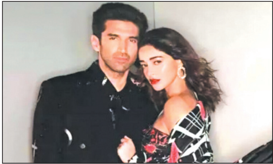
ମୁମ୍ବାଇ (ଏକେଡ୍): ଖୁବ୍‌ଶୀଘ୍ର ଯେକେବଳ ହେବ ନିର୍ବନ୍ଧ। ଏବେ ଆଉ ବାକି ଅଛି ଅଭିନେତା ଆଦିତ୍ୟ ରାୟ ଓ ଅଭିନେତ୍ରୀ ଅନନ୍ୟା ଲାଲ୍ ବାର୍ଡ଼ି। ନିଜଠାରୁ ୧୩ ବର୍ଷ ବଡ଼ ପୁରୁଷ ବନ୍ଧୁ ଆଦିତ୍ୟ ରାୟ କପୁରଙ୍କ ସହ ନିର୍ବନ୍ଧ କରିବେ ଅନନ୍ୟା। ଏନେଇ ଖୁବ୍ ଲାଲ୍ ବାର୍ଡ଼ି ନିଜଠାରୁ ୧୩ ବର୍ଷ ବଡ଼ ପୁରୁଷ ବନ୍ଧୁ ଆଦିତ୍ୟ ରାୟ କପୁରଙ୍କ ସହ ନିର୍ବନ୍ଧ କରିବେ ଅନନ୍ୟା। ଏନେଇ ଖୁବ୍

କୋରସୋରରେ ପୁନିଂ ଚାଲିଥିବା ସୂଚନା ରହିଛି। ନିର୍ବନ୍ଧ ପରେ ଖୁବ୍ ଶୀଘ୍ର ଏହି ଲଭ୍ ବାଟ୍‌ର ହାତଗଣ୍ଠି ପୂର୍ବର ବୋଲି ଚର୍ଚ୍ଚା ହେଉଛି। ତେବେ ଆଦିତ୍ୟ ଓ ଅନନ୍ୟାଙ୍କ ନିର୍ବନ୍ଧ କେଉଁଠି ହେବ, ତାହା ଜଣାପଡ଼ିନାହିଁ। ରିପୋର୍ଟ ମୁତାବକ ଏବେ ଉଭୟ ନିଜ ନିଜର କାମକୁ ନେଇ ବ୍ୟସ୍ତ ଅଛନ୍ତି। ସୂଚନାଯୋଗ୍ୟ, ନିଜତରଫେ ମୁକେଶ ଅମିନଙ୍କ ସହ ମୁଖ୍ୟ ଅନ୍ତର୍-ଏବଂ ରାଧିକା ମାର୍କଣ୍ଡଙ୍କ ପ୍ର-ଡ୍ରେଡ଼ିଂ ସମାପନରେ ଆଦିତ୍ୟ ଓ ଅନନ୍ୟା ସାମିଲ ହୋଇଥିଲେ। ଉଭୟ ଏକାଠି ପୋଟ ଦେଉଥିବା ଦେଖିବାକୁ ମିଳିଥିଲା। ଏହି ଫଟୋରେ ଆଦିତ୍ୟ ଓ ଅନନ୍ୟାଙ୍କୁ ରଖାବାର କପୁର ତିଆରିକରି କରୁଥିବା ଦେଖିବାକୁ ମିଳିଥିଲା, ଯାହା ସୋଶାଲ ମିଡିଆରେ ଖୁବ୍ ଭାଇଭାଇ ହୋଇଥିଲା।