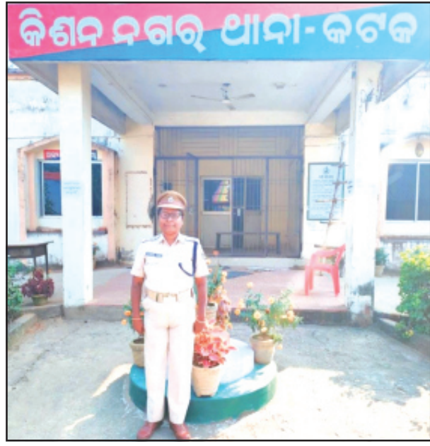
ରାଜ୍ୟରେ ପୁଲିସ କର୍ମଚାରୀଙ୍କୁ ଦେଖାଇବା ଏବଂ ଜନସାଧାରଣଙ୍କୁ ନ୍ୟାୟ ପ୍ରଦାନ ଉପରେ ଓଡ଼ିଶା ପୁଲିସ କାର୍ଯ୍ୟ କରିବା ପାଇଁ ବୁଦ୍ଧିଜୀବୀ

ପ୍ରଥମେ ଏସସିବି ମେଡ଼ିକାଲ ଓ ପରେ କଟକର ଏକ ଘରୋଇ ହସ୍ପିଟାଲରେ ଭର୍ତ୍ତି କରାଯାଇଥିଲା । ଯେଉଁଠି ତାଙ୍କର ମୃତ୍ୟୁ ହୋଇଥିଲା । ଏଥିରେ କିଶନନଗର ଆନା ଆଇଆଇସିଙ୍କ କାର୍ଯ୍ୟରେ ଅବହେଳା ଯୋଗୁଁ ସେ ଆତ୍ମହତ୍ୟା କରିଥିଲେ ବୋଲି ମୃତକଙ୍କ ପୁଅ ଅଭିଯୋଗ କରିଥିଲେ । ଏହି ଘଟଣାକୁ ବିଚାରକୁ ନେଇ ଘଟଣାର ତଦନ୍ତ କରି କିଶନନଗର ଆନା ଆଇଆଇସି ସମ୍ପୂର୍ଣ୍ଣ ରଖାଯାଇଛି । ଡିଏସି କାର୍ଯ୍ୟକୁ ନିଲମ୍ବିତ କରିଛନ୍ତି । ଆଇଆଇସିଙ୍କର ମନମୁଖୀ କାର୍ଯ୍ୟ ଓ କାର୍ଯ୍ୟରେ ଅବହେଳା ପାଇଁ ଗୋଟିଏ ନାରିକ ଲୋକ ଆତ୍ମହତ୍ୟା କରିଥିବା ଦର୍ଦ୍ଦର ବିଷୟ ହୋଇଥିଲା । ଏଭଳି ଘଟଣାରେ ଆଇଆଇସିଙ୍କର ନିଲମ୍ବନ ପରେ ମୃତକ ଗୁଣନିଧିଙ୍କ ପରିବାରକୁ କିଛିଟା ଆତ୍ମହତ୍ୟା କୁହାଯାଉଛି । ତେବେ କିଶନ ନଗର କାର୍ଯ୍ୟକ୍ରମ ସମ୍ପୂର୍ଣ୍ଣ