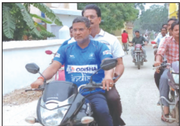
ବାଲେଶ୍ୱର(ଏନ୍.ଏମ.): ଅମାନ୍ତିଆକୁ ସାବଧାନ କରିଛି ଗ୍ରାମିକ ପୁଲିସ୍ । ବିନାହେଲମେଟରେ ବାଇକ ଚଳାଇଲେ ଦଣ୍ଡ ଗଣିବାକୁ ପଡୁଛି । ଏପରିକି ମନ୍ତ୍ରୀ ବିଧାନକୁ ବି

ବିନା ହେଲମେଟରେ ବାଇକରେ ଯିବାରୁ କଟିଲା ହଜାର ଟଙ୍କାର ଚାଲାଣ