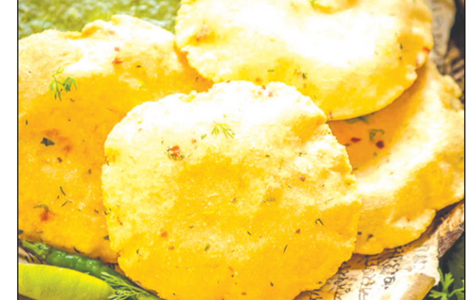
ଆବଶ୍ୟକ ସାମଗ୍ରୀ: ଅଟା, ଆଳୁ, କଟା କଞ୍ଚାଲଙ୍କା, ହଳଦି, ଲଙ୍କାଗୁଣ୍ଡ, ତେଲ, ଲୁଣ, ଲୁଆଣି, ଜିରା, ଧନିଆ ପତ୍ର ଓ ପୁଅଁ ।

ପ୍ରସ୍ତୁତ ପ୍ରଣାଳୀ: ପ୍ରଥମେ ଏକ ପାତ୍ରରେ ଅଟା ଆଣି ସେଥିରେ ସିଝା ଆଳୁକୁ ଗ୍ରେଟ୍ କରି ପକାନ୍ତୁ । ପରେ ସେଥିରେ ଲୁଣ, ଲଙ୍କା ପାଉଁର, ହଳଦି ପାଉଁର, ଗୋଟା ଜିରା, ଲୁଆଣି, ଧନିଆ ପତ୍ର, କଞ୍ଚା ଲଙ୍କା ଓ ଅଳ୍ପ ପୁଅଁ ପକାଇ ତାକୁ ଗୋଳାଇ ଦିଅନ୍ତୁ । ପରେ ପାଣି ଦେଇ ତାକୁ ଭଲ ଭାବରେ ଚକଟି ଦିଅନ୍ତୁ । ତା’ପରେ ତାକୁ ଓଦା କପଡ଼ା ଗୋଡ଼ାଇ ଅଧଘଣ୍ଟା ପର୍ଯ୍ୟନ୍ତ ଢାଳି ଦିଅନ୍ତୁ । ଏହା ପରେ ସେଥିରେ ଅଳ୍ପ ତେଲ ମିଶାଇ ଆଉ ଥରେ ଚକଟି ଦିଅନ୍ତୁ । ଏହାପରେ ପୁରି ପାଇଁ ଗୋଳା କରନ୍ତୁ, ଏଗୁଡ଼ିକୁ ପୁରି ପରି ବୋଲନ୍ତୁ । ପରେ କରେଇରେ ତେଲ ଗରମ କରି ବେଲି ରଖିଥିବା ପୁରିକୁ ଛାଣନ୍ତୁ । ପୁରି ଛାଣି ହୋଇଗଲା ପରେ ତାକୁ ଏକ ପାତ୍ରକୁ କାଢ଼ି ଦିଅନ୍ତୁ । ପ୍ରସ୍ତୁତ ହୋଇଗଲା ଆଳୁ ପୁରି ।