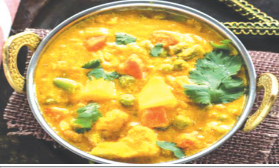
ଆବଶ୍ୟକ ସାମଗ୍ରୀ: ଫୁଲକୋବି, ବିନ୍ଦୁ, ଗାଜର, ଗାଜର, ଆଳୁ, ତେଲ, ପନିର, ଜିରା, ଗୋଟା ଧନିଆ, ଗୋଟା ଗରମ ମସଲା, କଟା ପିଆଜ, ଗୋଟା ରସୁଣ, ଅଦା, ମୋଗେ, କାଜୁ, ମଗଜ, ପୋଷ, କଷୁରା ମେଥି ଓ ଲୁଣ ।

ପ୍ରସ୍ତୁତି ପ୍ରଣାଳୀ: ଫୁଲକୋବି, ବିନ୍ଦୁ, ଗାଜର ଓ ଆଳୁକୁ କାଟି ଭଲ ଭାବେ ଯୋଗ ଏକ ପାତ୍ରରେ ରଖନ୍ତୁ । ଏବେ କରେଳରେ ତେଲ ଗରମ କରନ୍ତୁ । ତେଲ ଗରମ ହୋଇଗଲେ ଫୁଲକୋବି, ବିନ୍ଦୁ, ଗାଜର ଓ ଆଳୁକୁ ପକାଇ ଅଳ୍ପ ଭାଙ୍ଗି ଦିଅନ୍ତୁ । ସେଥିରେ ଗ୍ରୀନ୍ ମଟର ମଧ୍ୟ ପକାନ୍ତୁ । ଏ ସବୁ ଭାଙ୍ଗି ହେଲା ପରେ ଏକ ପାତ୍ରକୁ କାଢ଼ି ଦିଅନ୍ତୁ । ପରେ କଟା ପନିରକୁ ମଧ୍ୟ ଭାଙ୍ଗି ଏକ ପାତ୍ରକୁ କାଢ଼ି ଦିଅନ୍ତୁ । କରେଳରେ ପୁଣି ତେଲ ଗରମ କରନ୍ତୁ । ସେଥିରେ ଜିରା, ଗୋଟା ଧନିଆ ଓ ଗୋଟା ଗରମ ମସଲା ପକାଇ ଦିଅନ୍ତୁ । ତା'ପରେ କଟା ପିଆଜ, ଗୋଟା ରସୁଣ ଓ ଅଦାକୁ ପକାଇ ଭାଙ୍ଗି ଦିଅନ୍ତୁ । କିଛି ସମୟ ପରେ ସେଥିରେ କଟା ମୋଗେ ପକାନ୍ତୁ । ଭଲ ଭାବେ ଭାଙ୍ଗି ପରେ ଏହି ମସଲାକୁ ଏକ ପାତ୍ରକୁ କାଢ଼ି ଦିଅନ୍ତୁ । ଏବେ ଏହି ମସଲାରେ କାଜୁ, ମଗଜ ଓ ପୋଷ ମିଶାଇ ଗ୍ରାଭିଙ୍ଗ କରି ଦିଅନ୍ତୁ । ତା'ପରେ କରେଳରେ ତେଲ ଗରମ କରନ୍ତୁ । ତେଲ ଗରମ ହେବା ପରେ ସେଥିରେ ହଳଦି ଗୁଣ୍ଡ ଓ ଲଙ୍କା ଗୁଣ୍ଡ ପକାଇ ଗୋଳାଇ ଦିଅନ୍ତୁ । ଏହା ପରେ ସେଥିରେ ଗ୍ରାଭିଙ୍ଗ କରିଥିବା ମସଲାକୁ ପକାଇ ଅଳ୍ପ ସମୟ ପାଇଁ କଷନ୍ତୁ । କଷିଲା ବେଳେ ଅଳ୍ପ କଷୁରା ମେଥି ପକାଇ ଦିଅନ୍ତୁ । ପରେ ଭାଙ୍ଗି ରଖୁଥିବା ପନିରକୁ ସେଥିରେ ପକାଇ ଗୋଳାଇ ଦିଅନ୍ତୁ । ଆବଶ୍ୟକ ଅନୁସାରେ ପାଣି ଦେଇ ଦିଅନ୍ତୁ । ତା'ସହିତ ସ୍ୱାଦ ଅନୁସାରେ ଲୁଣ ପକାଇ କରେଳକୁ ଢାଳି ଦିଅନ୍ତୁ । ପରିବା ସିଝି ଗଲା ପରେ କରେଳକୁ ତଳକୁ ଓଲୁଟା ଦିଅନ୍ତୁ । ପ୍ରସ୍ତୁତ ହୋଇଗଲା ଭେଟ୍ କୋରମା ।