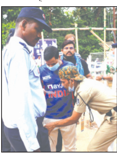
ପାନ, ଗୁଡ଼ଖ, ଖଇନି ପକେଟରେ ଅଛି କି ?

ପ୍ରବଳ ଜନଗହଳରେ ସୁଯୋଗ ନେଇ କିଛି ପାଇଥିବା ଆଶାରେ ଲୁଚେରାମାନଙ୍କ କାର୍ଯ୍ୟ ମଧ୍ୟ ବଢ଼ିଯାଇଥିଲା । ବାରବାଟୀରେ ମ୍ୟାଚ ଦେଖିବା ଲାଗି ଦର୍ଶକ ମାନେ ବ୍ୟାକୁଳ ହେଉଥିବାବେଳେ ଗହଳିରେ ଲୁଚିଆ ମାନେ ମୋବାଇଲ୍, ଟାଙ୍କି ଆଦି ଲୁଚିବା ପାଇଁ ସକ୍ରିୟ ହୋଇପଡ଼ିଥିଲେ । ତେବେ ଗ୍ୟାଲେରୀ-୨ ନମ୍ବରରେ ଏକ ଅଭାବନୀୟ ଘଟଣା ଘଟିଥିଲା । ଜଣେ ଲୁଚେରା ମୋବାଇଲ୍ ଚୋରି କରି ଦର୍ଶକଙ୍କ ମାତ୍ର ତରଫରେ ଶୌଚାଳୟରେ ଲୁଚି ରହିଥିଲା । ଦୀର୍ଘ ଘଣ୍ଟା ଧରି ଲୁଚି ରହିବା ଫଳରେ ଦର୍ଶକ ମାନେ ତାକୁ କାନ୍ଦୁ କରିନେଇଥିଲେ । ଖୁବ୍ ଉତ୍ତମ ମାଧ୍ୟମ ଦେବା ସହ ପୋଲିସର ଜିମା ଦେଇଥିଲେ । ଚୋରି ହୋଇଥିବା ମୋବାଇଲ୍ ପାଇଥିଲେ ।