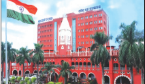
କଟକ(ଏନ୍.ଏମ୍.): ଓଡ଼ିଶା ହାଇକୋର୍ଟରେ ଯୋଗଦେବେ ୪ଜଣ ନୂତନ ବିଚାରପତି । ଏ ନେଇ ସୁପ୍ରିମକୋର୍ଟଙ୍କ